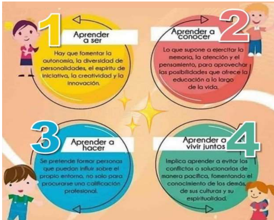
Ilustración 1: https://masinteresantes.com/4-pilares-de-la-educacion/