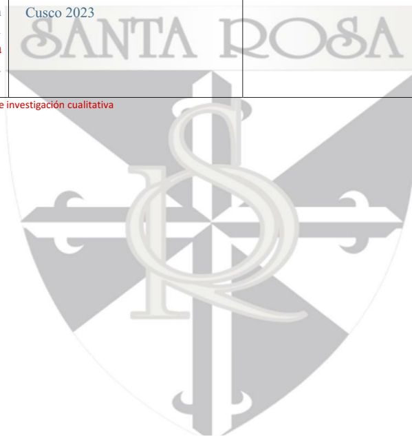
Tabla 6 Matriz de consistencia lógica de investigación cualitativa