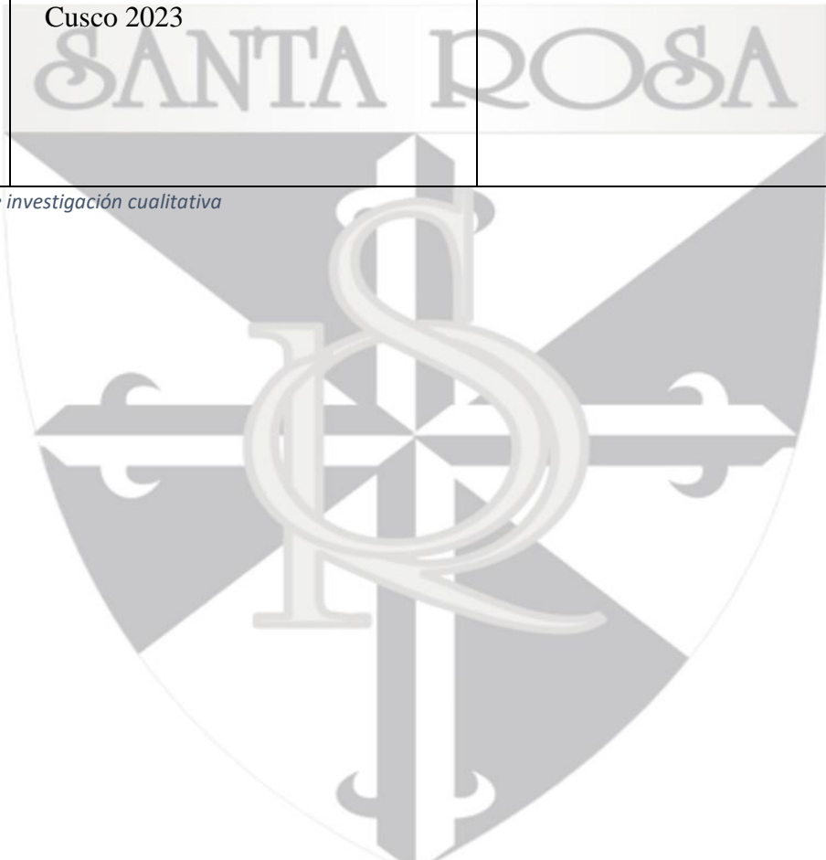
Tabla 6 Matriz de consistencia lógica de investigación cualitativa