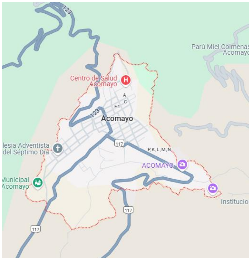
Figura 1 Ubicación